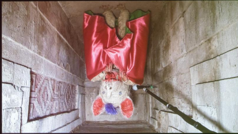
Naomi Rincón Gallardo, Sonnet of Vermin , 2024.