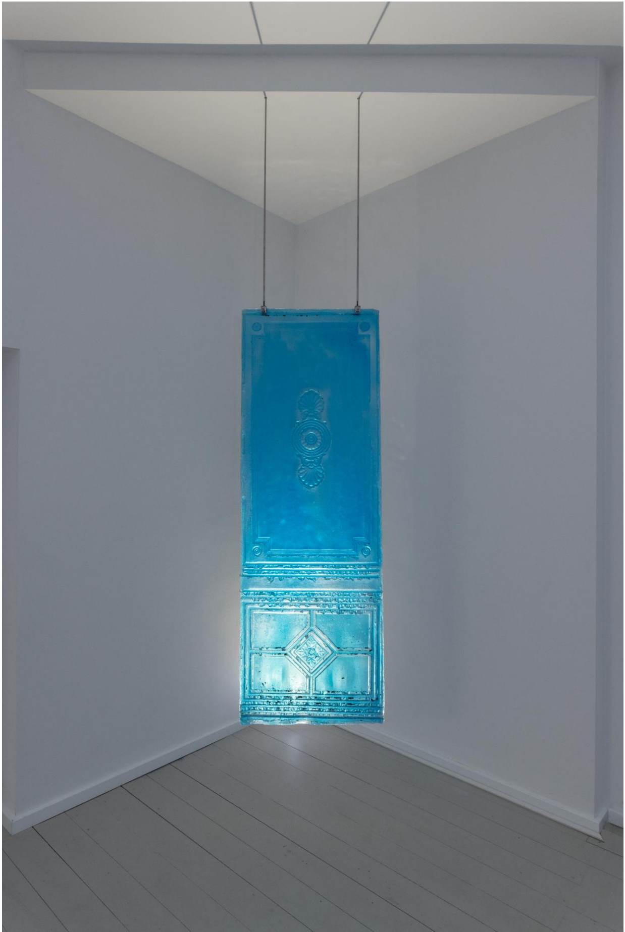
Constantin Hartenstein, Trap (II) , 2022.