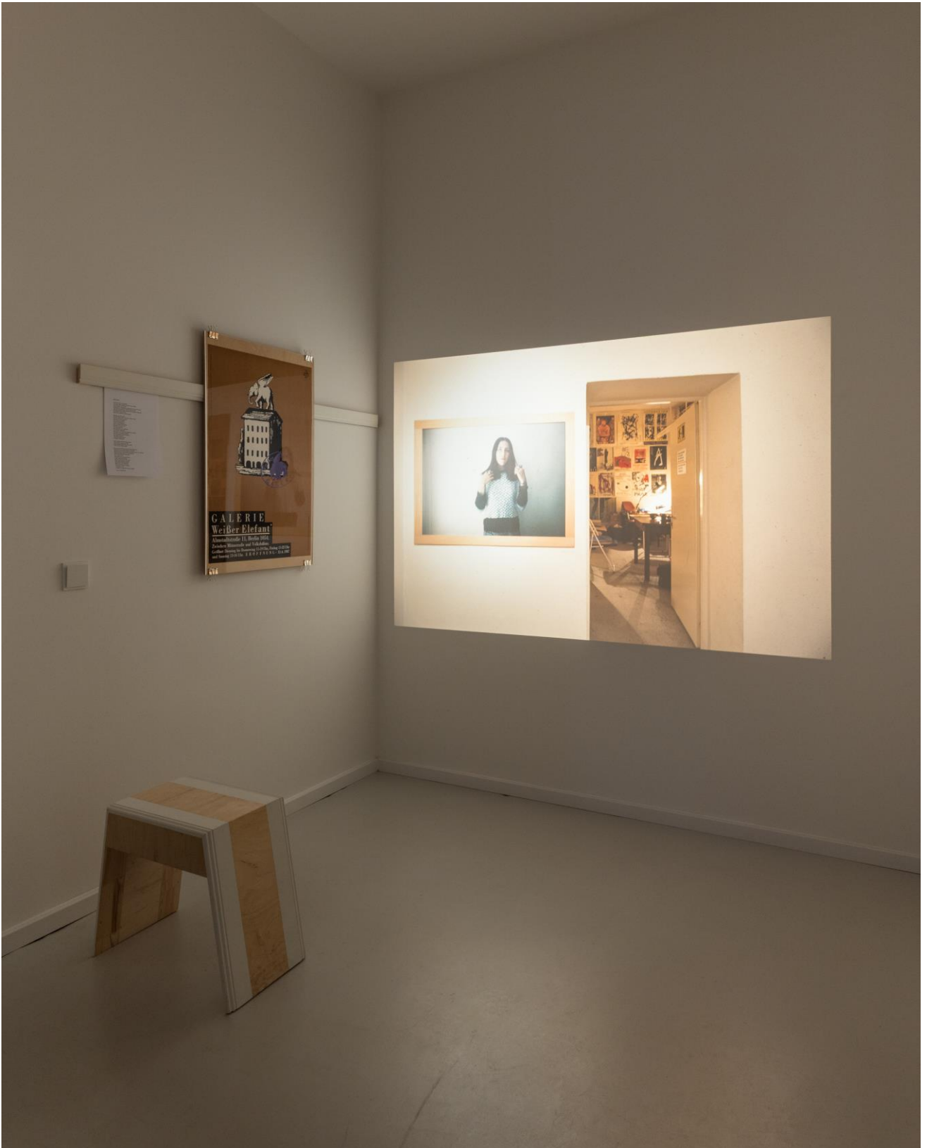
Dia-Dokumentation der / dia documentation of galerie weisser elefant .