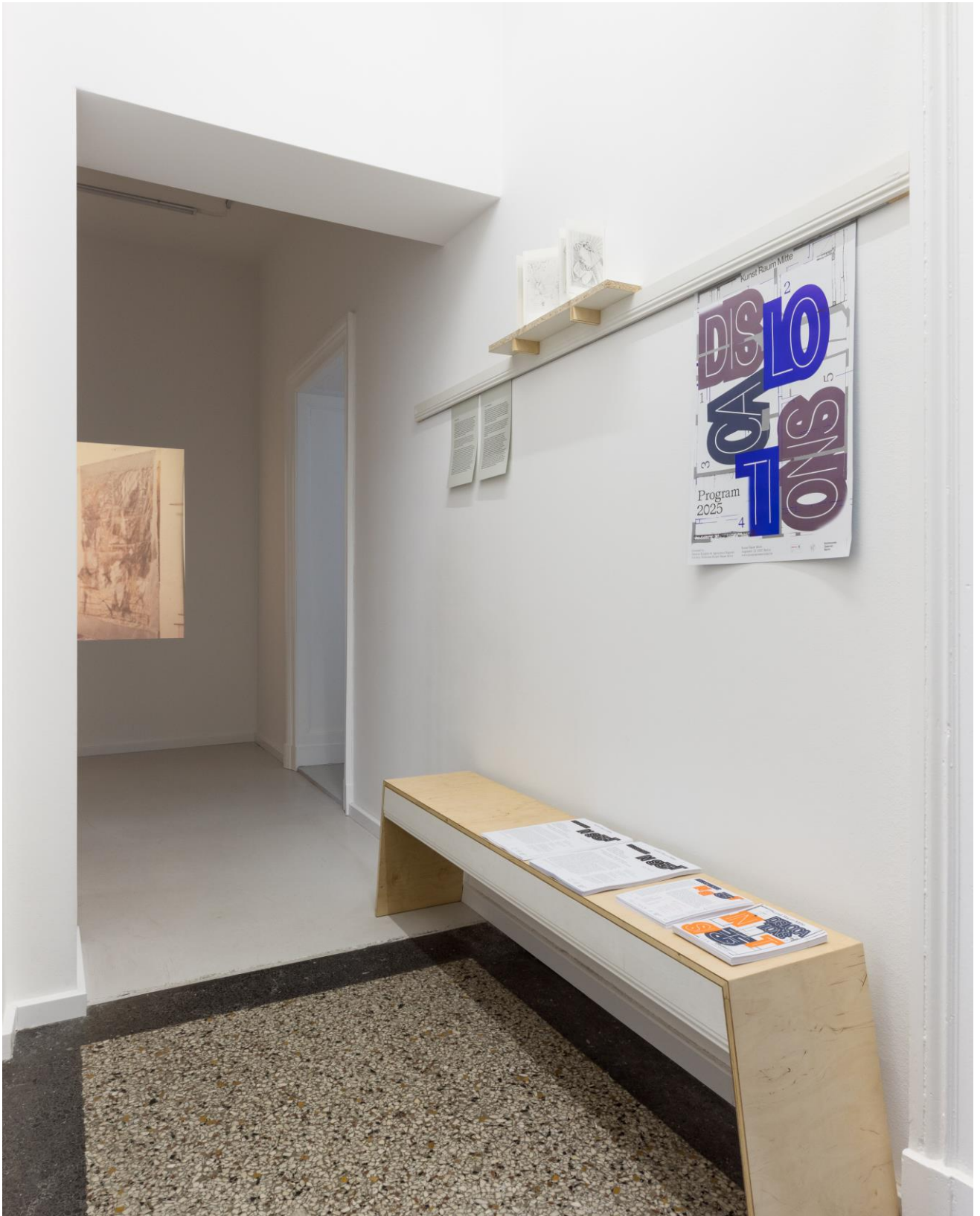
Archivmaterial der / archive material of galerie weisser elefant . Foto: Jannis Uffrecht