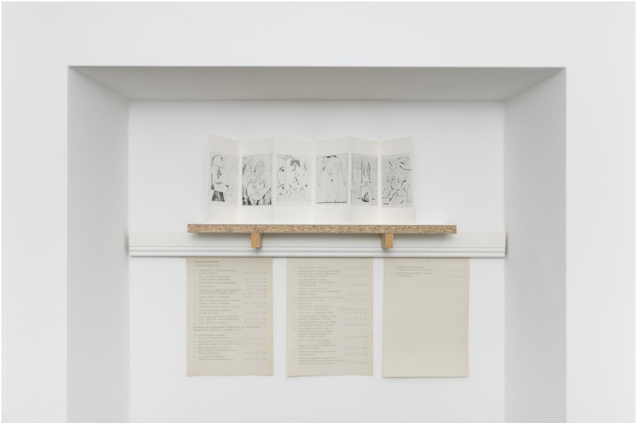
Archivmaterial der / archive material of galerie weisser elefant . Foto: Jannis Uffrecht