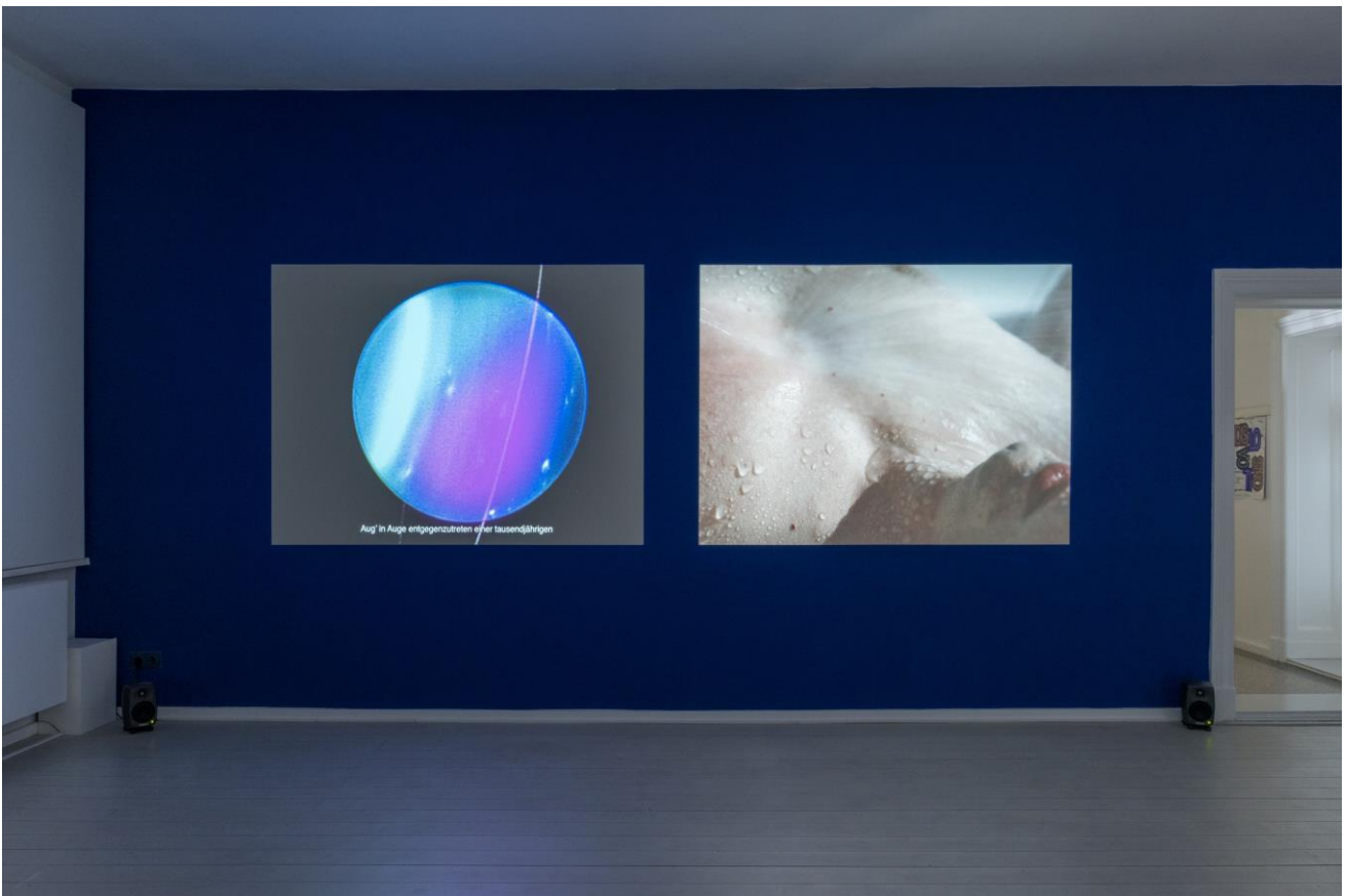
Philipp Gufler, The Beginning of Identification, and its End , 2024. Photo: Jannis Uffrecht