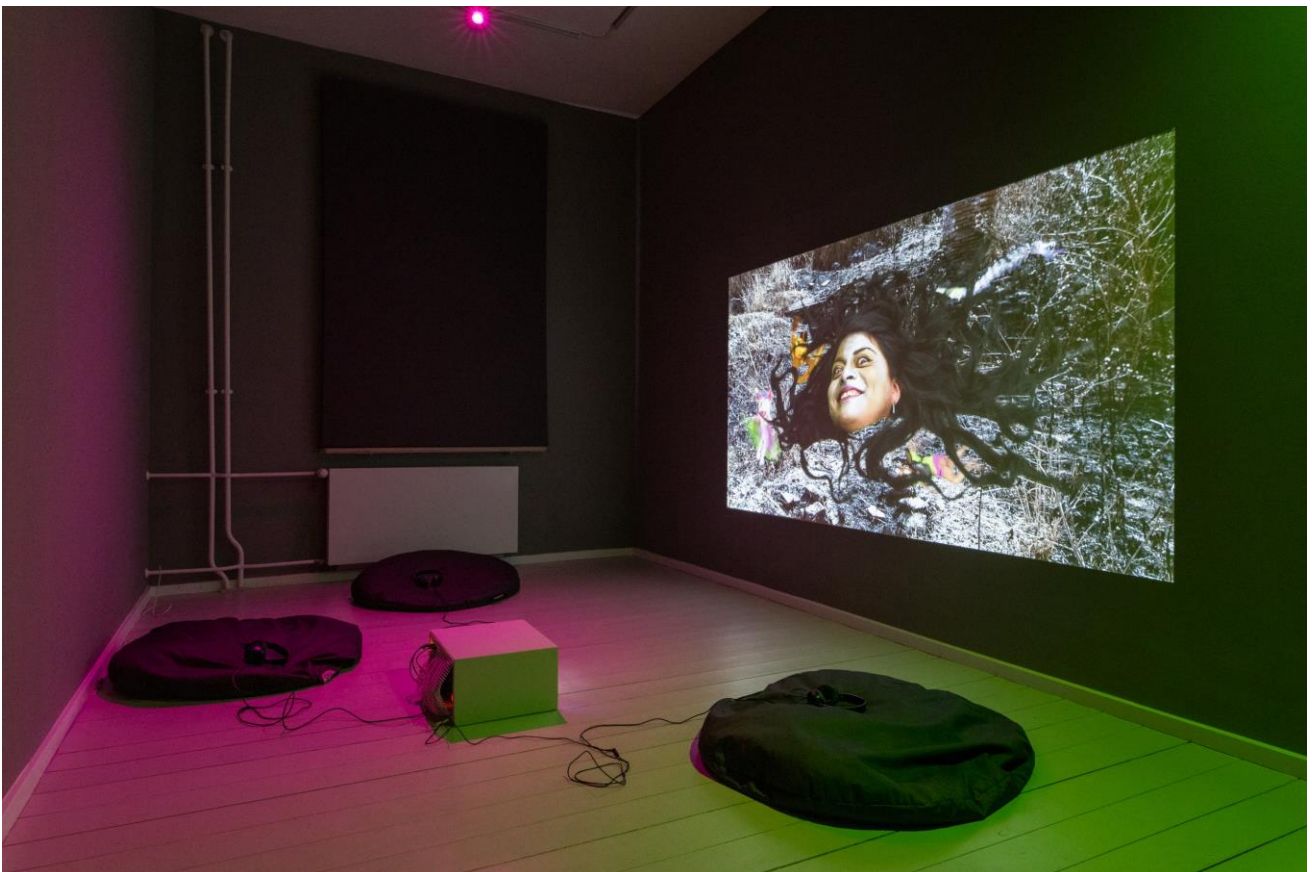
Naomi Rincón Gallardo, Sonnet of Vermin , 2024.