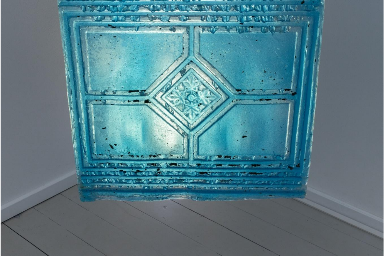
Constantin Hartenstein, Trap (II) , 2022.