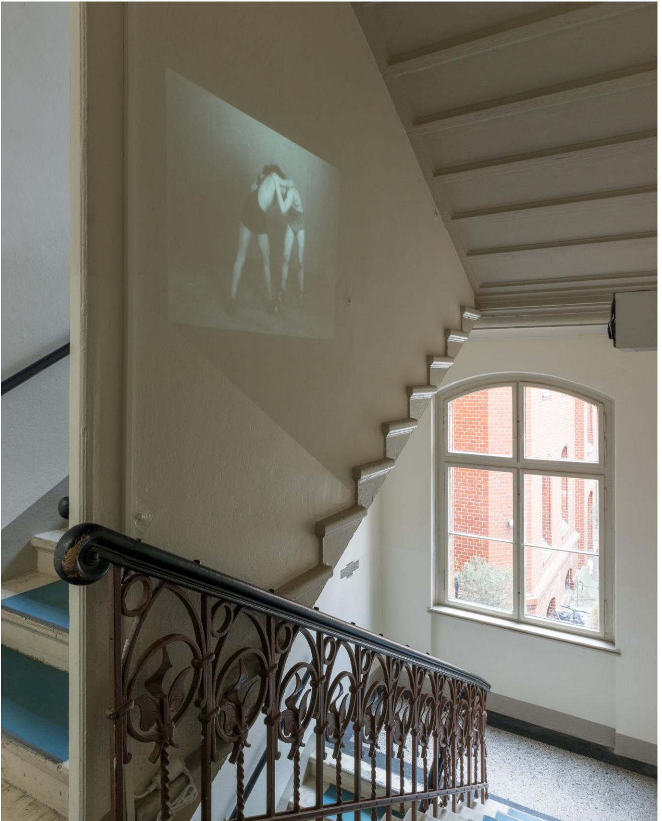
Constantin Hartenstein, Zeit , 2011.