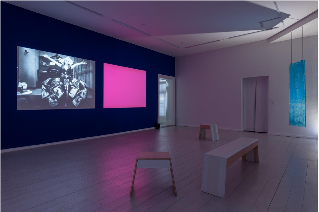
DISLOCATIONS—in sight, 2025, installation view, Kunst Raum Mitte.